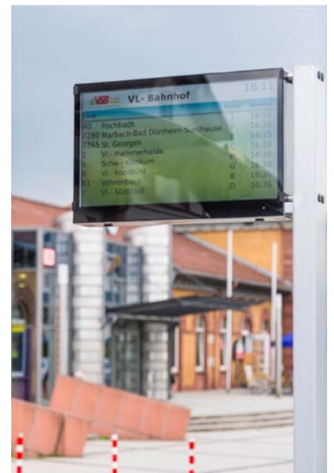
Infobildschirm am Busbahnhof Villingen

Mit der Einführung der VSB Card können auch die VSB AboCards ebenfalls mit zusätzlichen EinzelTickets, Wochen- oder MonatsCards für den vom eigentlichen „Aboweg“ abweichende Gelegenheitsfahrten beschrieben werden – d.h. VSB AboCard mit integrierter VSB Card.