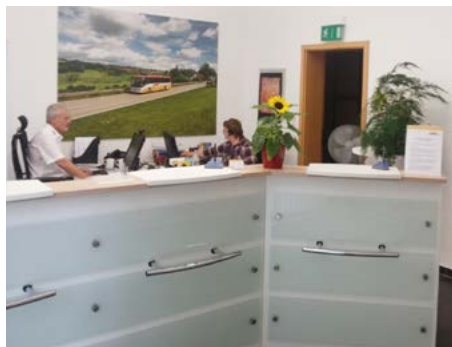
Das Kunden-Center des VSB im Villingen Bahnhof direkt am Busbahnhof